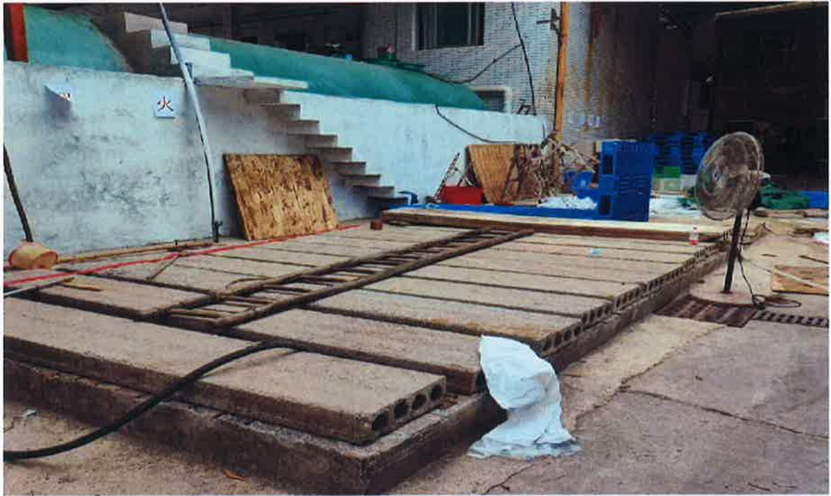
图 3：事发后污水池现场勘察图一