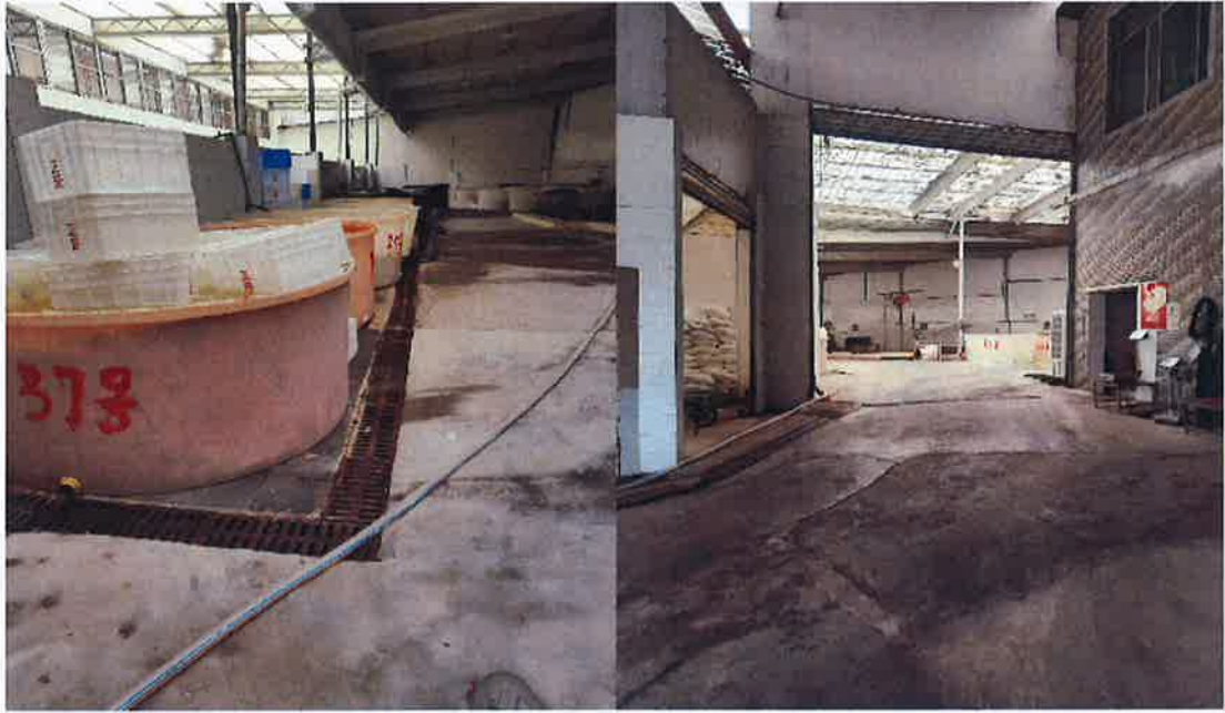
图 7：污水管网现场勘察实际图