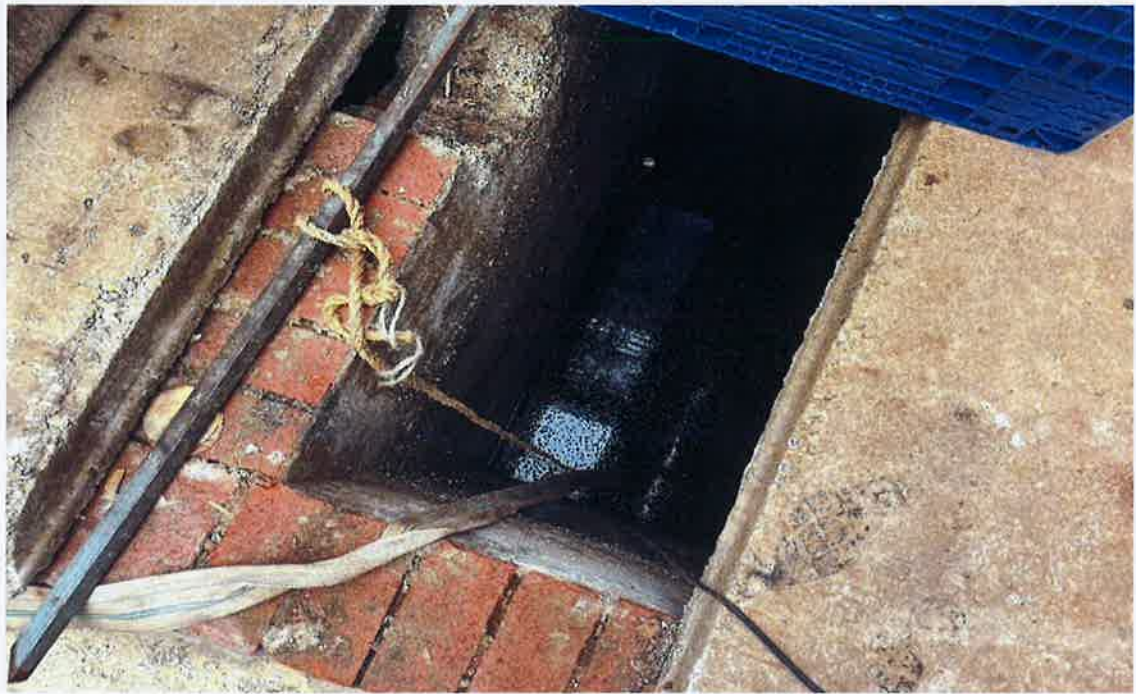
图 5：事发后污水池现场勘察图三