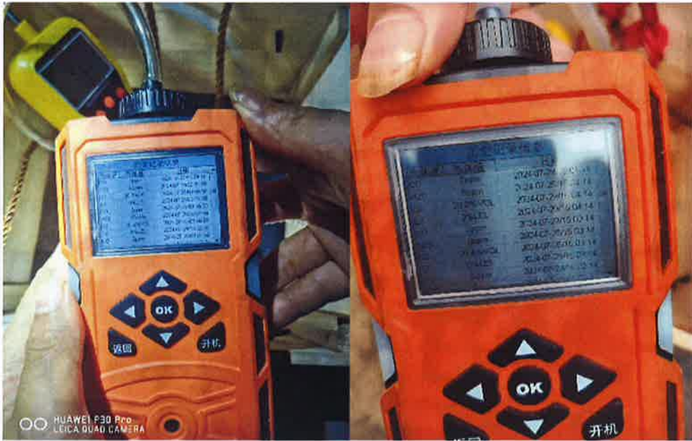
图 8：7 月 29 日事故发生处检测图一