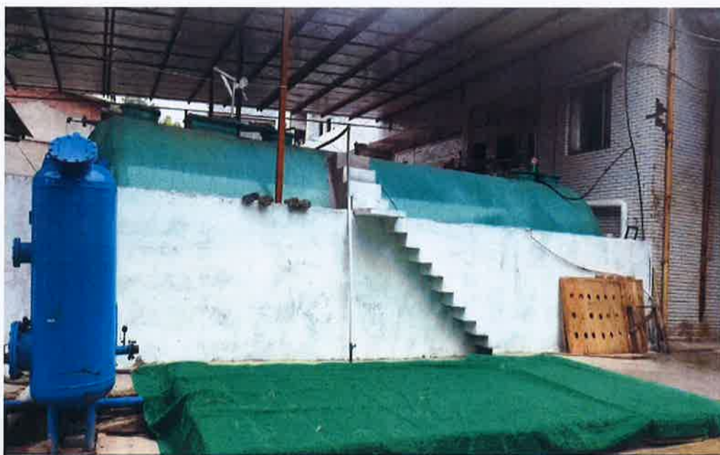
图 2：事发前污水池（铺设人造草坪）图