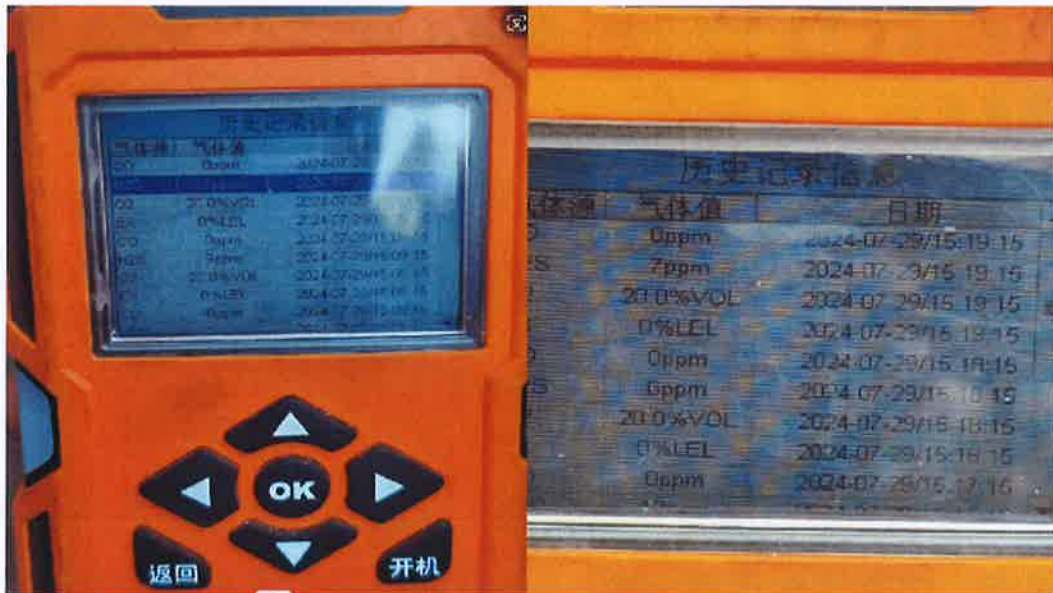
图 9：7 月 29 日事故发生处检测图二