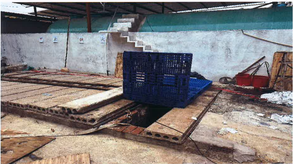
图 4：事发后污水池现场勘察图二